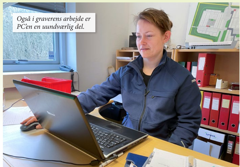
Også i graverens arbejde er PC'en en uundværlig del.