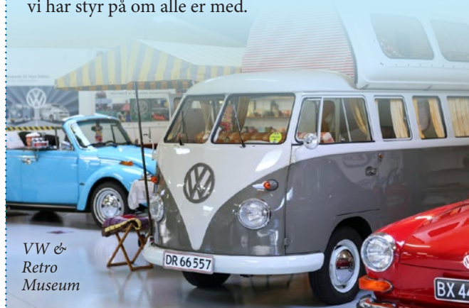
VW & Retro Museum

Ved tilmelding vil vi gerne vide hvor I står på bussen, så vi har styr på om alle er med.